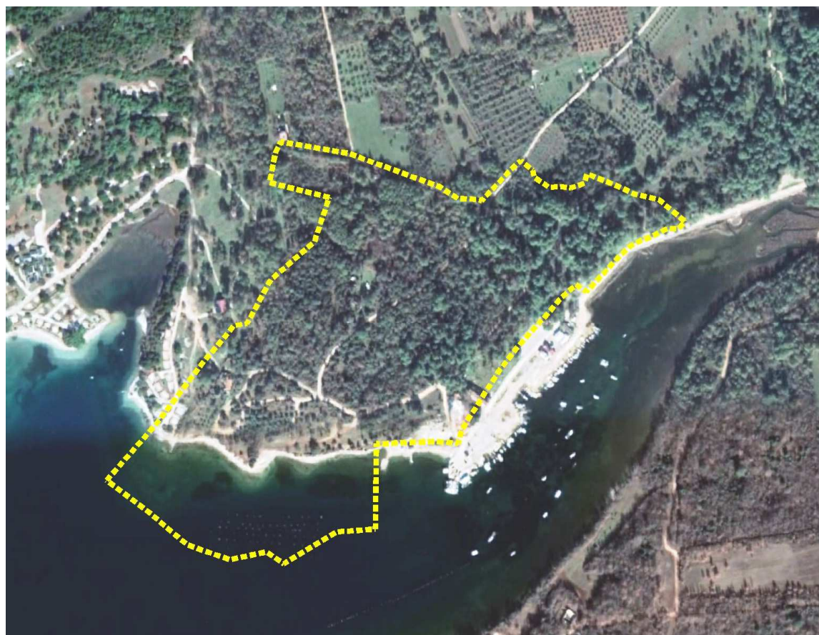
Obuhvat Izmjena i dopuna Plana prikazan na ortofoto (Google earth) snimku