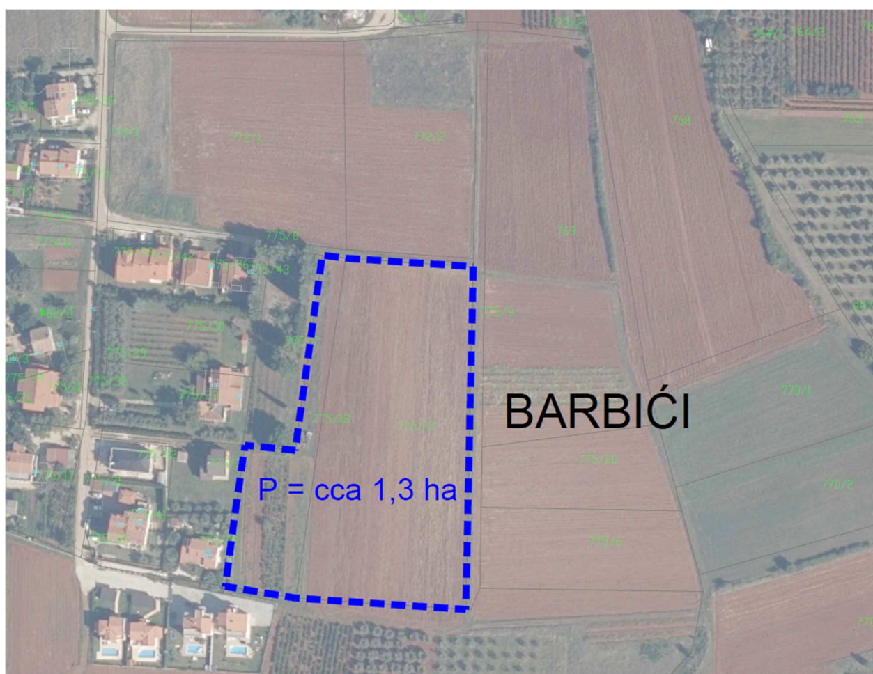
Obuhvat UPU dijela naselja Barbići